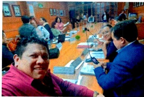
Segunda Sesión Extraordinaria del Ayuntamiento 2024-2027

2.- Asistí a la Segunda Sesión Extraordinaria del Ayuntamiento 2024-2027 , realizada el día lunes 23 de septiembre del 2024 a las 19:00 horas, en la sala de sesiones transmitida en vivo en la página oficial del Ayuntamiento, para análisis, debate y aprobación del Proyecto de Ley de Ingresos del Ejercicio Fiscal 2025, de la cual y en mi carácter de integrante del órgano de gobierno, mi voto fue a favor de dicho Proyecto de Ley de Ingresos.