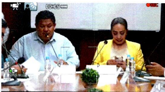
Presentación del Proyecto de la Modificación del Presupuestos de Egresos del Ejercicio Fiscal 2024.

En cuanto a la presentación del Proyecto de la Modificación del Presupuestos de Egresos del Ejercicio Fiscal 2024, misma de la cual al haber existido una mesa de trabajo previa y fundamentada en sus acciones, mi voto fue a favor de dicha modificación.