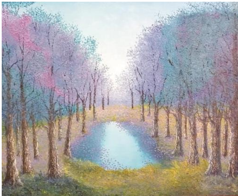
“Jacarandas” – Juan Ugalde Olguin Óleo a espátula